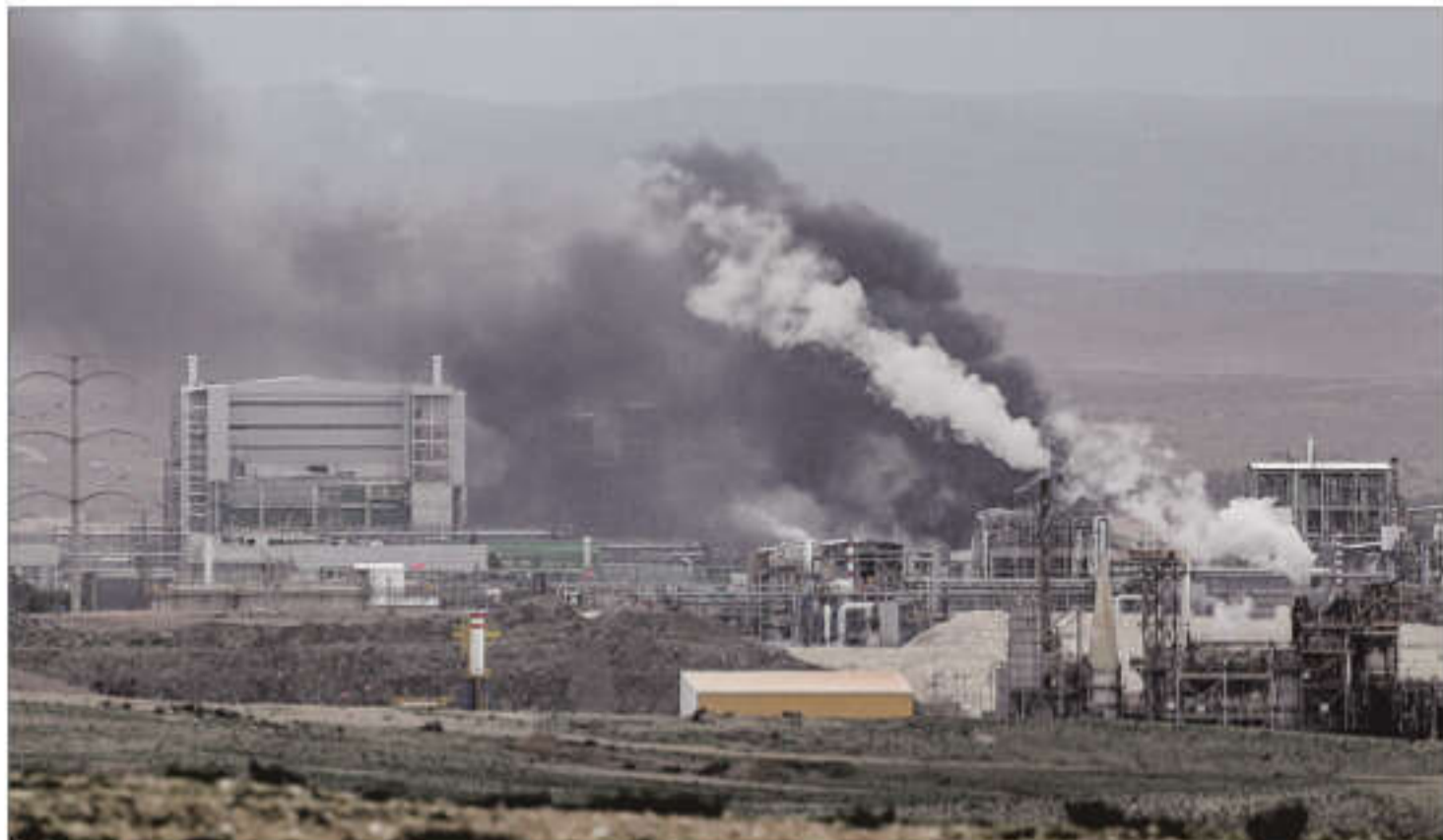
Smoke rises following an Iranian missile strike in Southern Israel on Sunday

Mohammad Baqer Qalibaf accused the US of sending messages about possible negotiations while at the same time secretly planning to send in troops, adding that Tehran was ready to respond if US soldiers were deployed.