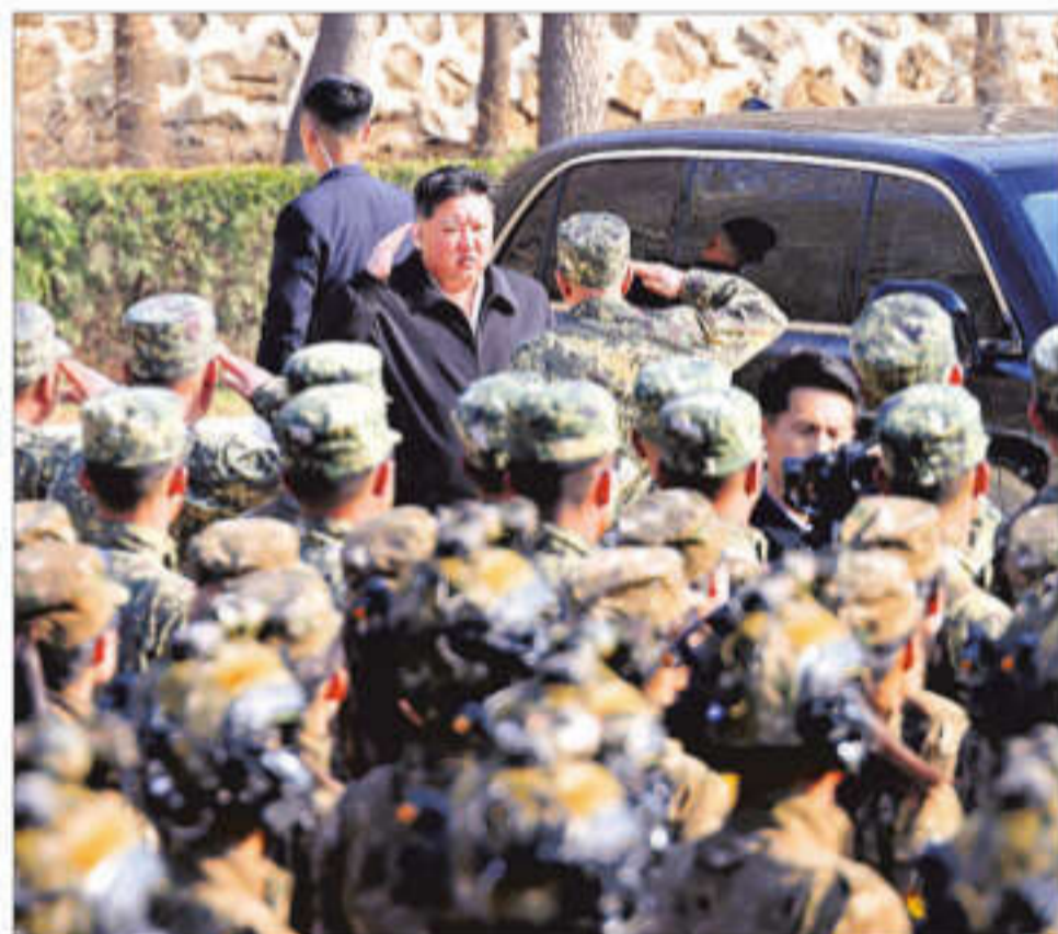
North Korean leader Kim Jong Un visits a special operations training base

KCNA reported the test was conducted as part of the country's five-year arms build-up meant to upgrade "strategic strike means," a term referring to nuclear-capable ballistic missiles and other weapons. Kim said the latest engine