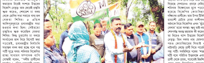
মোদির সভা স্থগিত করার ব্যাপারে বিক্ষুব্ধ চা বাগানকারীরা।

নিজ প্রতিনিধি, অলপাইগুড়ি, ২৯ মার্চ: চা বাগানের জনসমর্থনে ধস! অলিপুরদুয়ার থেকে মোদির সভা সরাতে বাধ্য হল বিজেপি।