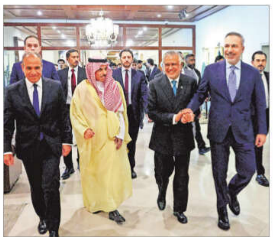
Foreign Ministers Badr Abdelatty of Egypt, Prince Faisal bin Farhan Al Saud of Saudi Arabia, Ishaq Dar of Pakistan and Hakan Fidan of Turkey meet to discuss regional de-escalation, in Islamabad on Sunday

The two-day quadrilateral summit is Pakistan's attempt to broker peace in West Asia. After the meeting, the Saudi Foreign Minister Prince Faisal bin Farhan called on Prime Minister Shehbaz Sharif and discussed various matters of bilateral and regional interest. Earlier, Dar held a meeting with the Saudi Foreign Minister on the sidelines of the quadrilateral huddle, the Foreign Office (FO) said. "During the meeting, the two leaders held detailed discussions on the evolving regional and international developments," it said. —PTI